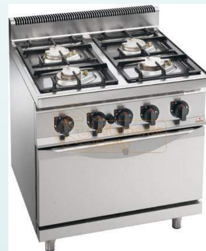
Gasa fornelo je kvar flamingoj