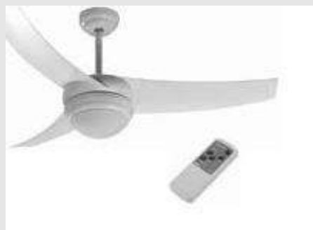
LUMVENTOLILO KUN TELEREGILO