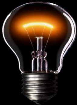
Inkandeska lampo aŭ ampolo