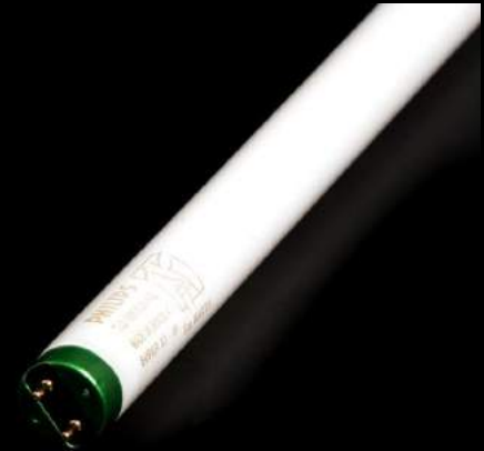
Fluoreska lampo aŭ lumtubo