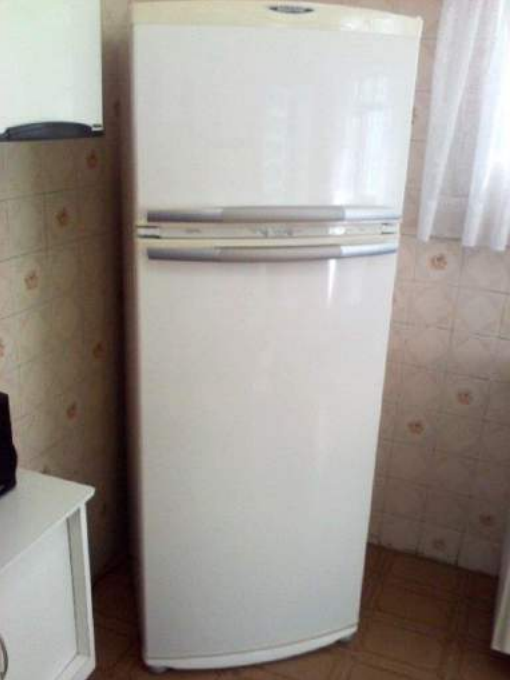
Ordinara (simpla) fridujo