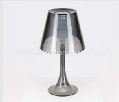
LUMŠIRMILO EL VITRO