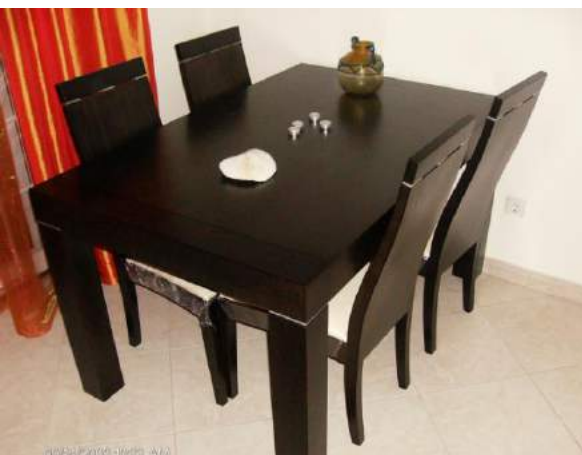
MANÛOTABLO EL PALISANDRO